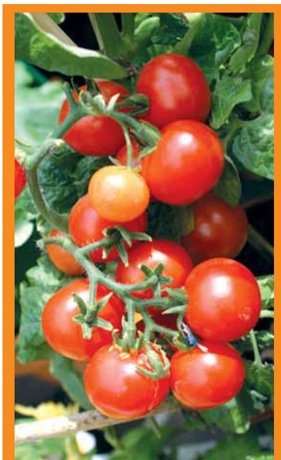
Produção de tomate tem grande importância socioeconômica no Nordeste

O BNB-Etene acaba de divulgar informe sobre a cultura de tomate na Região durante o intervalo entre os censos agropecuários de 1995/1996 e 2006. O trabalho indica que no período, ao contrário do ocorrido em âmbito nacional, no Nordeste verificou-se redução no total de estabelecimentos que usam agrotóxico no tomateiro, resultado provavelmente relacionado com a pressão dos consumidores e o desenvolvimento de variedades resistentes a doenças. O documento do Etene detalha safra, área colhida, uso de tecnologia, evolução do número de propriedades e da produção por grupo de área ocupada por tomate na Região. A atividade possui grande relevância socioeconômica, especialmente nos estados da Bahia, Pernambuco e Ceará, os maiores produtores da região.