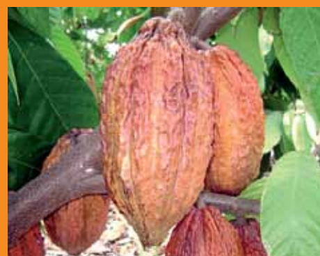
Projeto visa introduzir fruto no semiárido

O semiárido nordestino poderá passar a produzir cacau, em breve, como consequência das pesquisas em andamento no Vale do São Francisco, em Petrolina. Uma parceria do BNB-Etene-Fundeci com a Embrapa, iniciada em 2007, garante a execução de um projeto, cujo objetivo é a aclimação de fruteiras de outras áreas às condições do semiárido. O cacau apresenta resultados promissores para o seu cultivo irrigado.