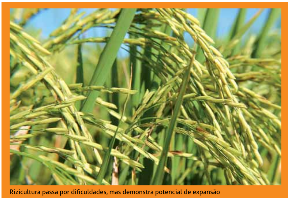
Rizicultura passa por dificuldades, mas demonstra potencial de expansão

Veja mais detalhes sobre a cultura do arroz no Nordeste em: